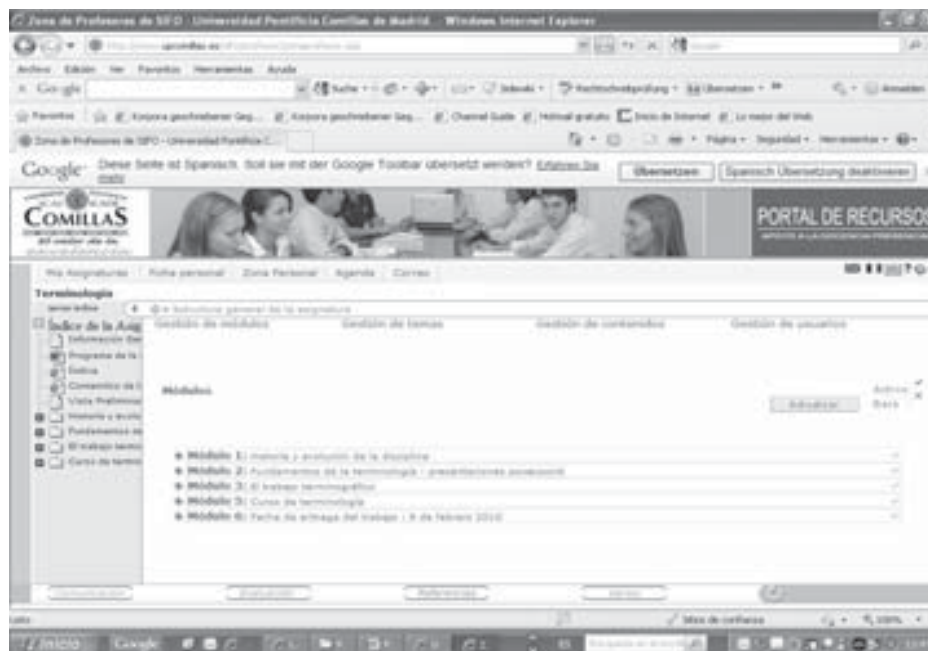
Figura 1. La asignatura “Terminología” en el Portal de Recursos de la Universidad Pontificia Comillas

de Ciencia y Tecnología . Recuperado el 20 de diciembre de 2009, de http://recyt.fecyt.es/index.php/HS/article/viewFile/6033/6013